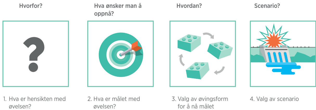
FIGUR 1. Spørsmål man må ta stilling til forut planleggingsprosessen.

Disse spørsmålene bør drøftes før man velger øvingsform: