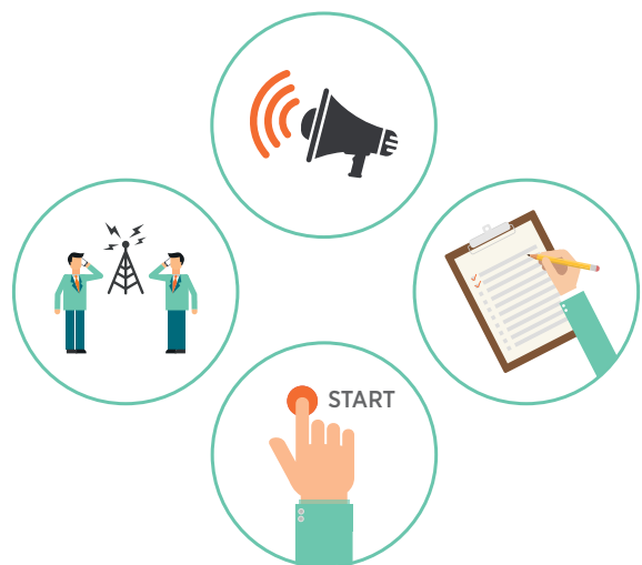
FIGUR 2. Ulike typer funksjonsøvelser

Funksjonsøvelser er en samlebetegnelse for øvelser som tester en eller flere funksjoner hos en aktør. Det kan gjelde teknikk, organisering eller evner. I funksjonsøvelser handler det om hva som skal øves mer enn hvordan øvelsen skal gjennomføres. Funksjonsøvelser kan også omtales som prosedyreøvelser.