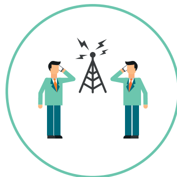
FIGUR 4. Sambandsøvelse

Et eksempel på en sambandstest kan være å opprette en forbindelse mellom to tekniske løsninger. Dette kan være telefon, radio, epost eller satellitt-telefon. En sambandstest via Nødnett kan gjennomføres ved at en person ringer opp en talegruppe. Etter anropet anmodes den øvede om å bytte til en annen talegruppe og deretter gjennomføre anropet på nytt.