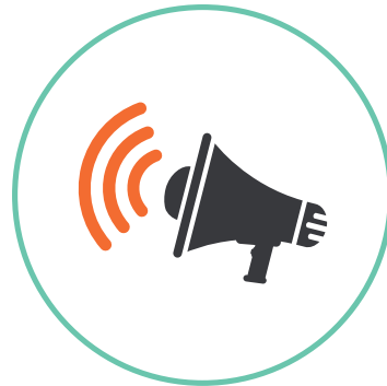
FIGUR 3. Varslingsøvelse

Den kan også brukes til å teste intern håndtering, for eksempel ved at et sykehus varsler sine ansatte gjennom sykehusets varslingsystem.