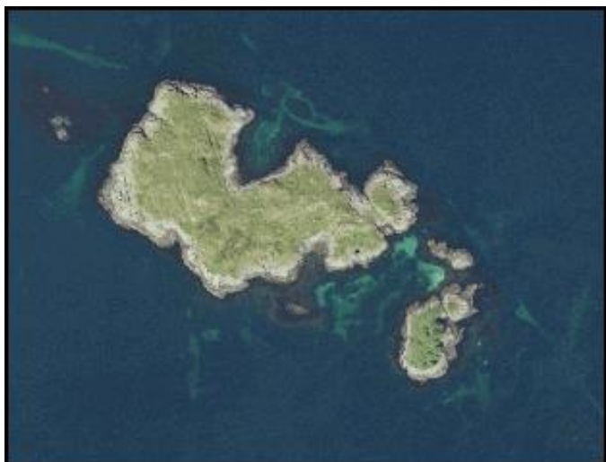
Flyfoto av Store Ramsholmen og Småramsholmen