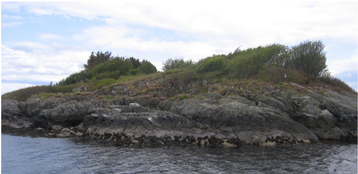
Småramsholmen i mai 2009. Holmen er gjengrodd med rognetre/kratt og grantre.