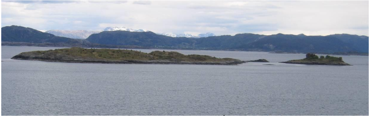
Store Ramsholmen og Småramsholmen i mai 2009, sett fra Årsholmen.