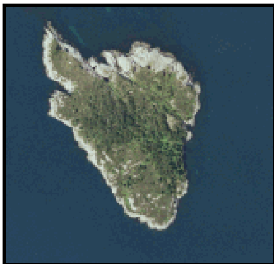
Flyfoto av Årsholmen før skogryddinga i 2008/2009

Talet på hekkande fuglar i Ramsholmen naturreservat har gått kraftig ned, og området har truleg ikkje vore nytta for hekking siste åra. I tillegg til næringsmangel i sjøen kan dette også skuldast attgroing, som har redusert tilgjengeleg hekkeareal for sjøfugl. Rognetrea og granene på Småramsholmen bør fjernast. Store areal på Årsholmen er framleis dekt av buskfuru, sjølv om noko av skogen vart saga ned tidleg i 2009. Det er såleis behov for ytterlegare skogrydding på Årsholmen. Ut frå omsyn til hekkande sjøfugl er det ønskjeleg å fjerne all skogen. Også dei spreidde små lauvtræa på Store Ramsholmen bør ryddast vekk. Hogstavfall og grov lyng/kratt må ryddast og brennast før holmane på ny fullt ut blir tilgjengeleg for hekking. Etter dette er det eit mål å halde tre og kratt nede på alle tre holmane i framtida.