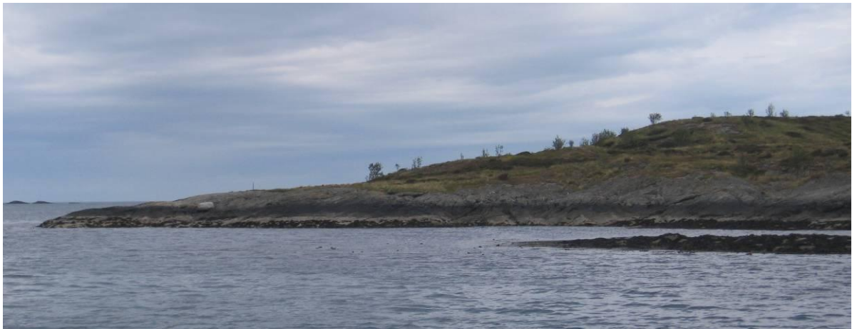
Store Ramsholmen i mai 2009. Holmen har mange spredde små lauvtre.