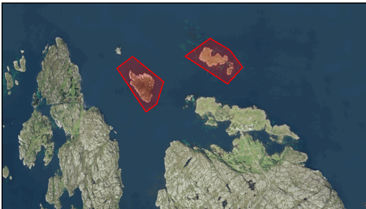
Flyfoto av Ramsholmen naturreservat, som ligg nord for Leknesøy i Solund kommune. Grensene for naturreservatet er merkte med raudt.

Reservatet dekkjer eit areal på om lag 309 dekar, av dette er om lag 99 dekar landareal. Området omfattar holmane Årsholmen, Store Ramsholmen og Småramsholmen med nærliggande skjer, som ligg nord for Leknesøy i Buefjorden. Jordsmonner er grunt. Vegetasjonen på Store Ramsholmen er prega av lyng og strandeng. Berggrunnen er av devonske bergartar. Småramsholmen er tilgrodd med rogn og gran, og store delar av Årsholmen er tilgrodd med buskfuru.