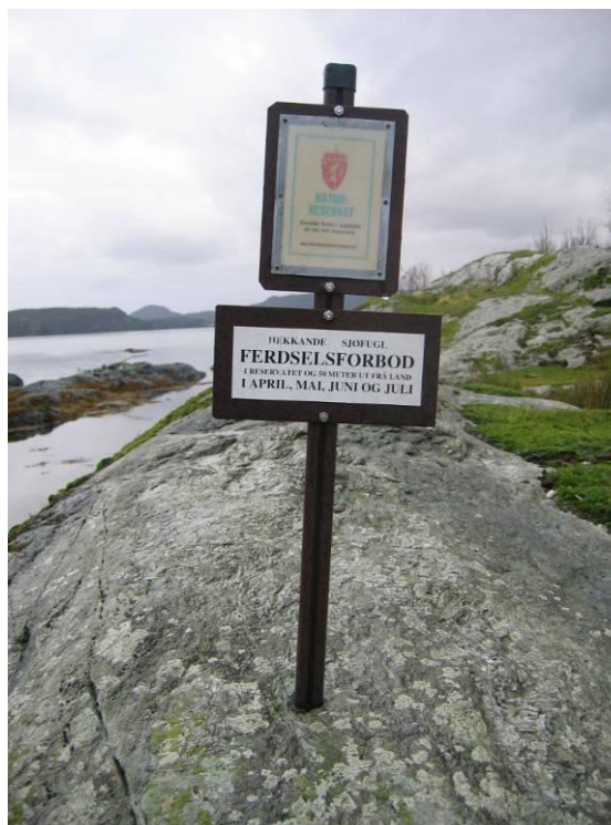
Standard verneskilt i sjøfuglreservata.

Med ein stadig veksande privat småbåtflåte på kysten og i fjordane, er det viktig å informere sjøfarande om vernet og om ferdselsforbodet i hekketida. Vi ser det også som eit mål å informere om fuglelivet og naturkvalitetane i sjøfuglreservata. Fylkesmannen er i gang med å utarbeide informasjonsplakatar om naturreservata i fylket, med m.a. kart, foto og vernereglar, til å hengje opp der båtfolk ferdast (t.d. næraste større småbåthamn).