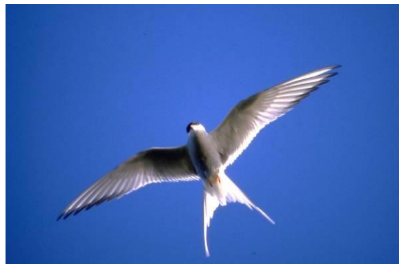
Det er eit bevaringsmål at fiskemåse (til venstre) og terne (her raudnebbterne) skal hekke i Ramsholmen naturreservat.