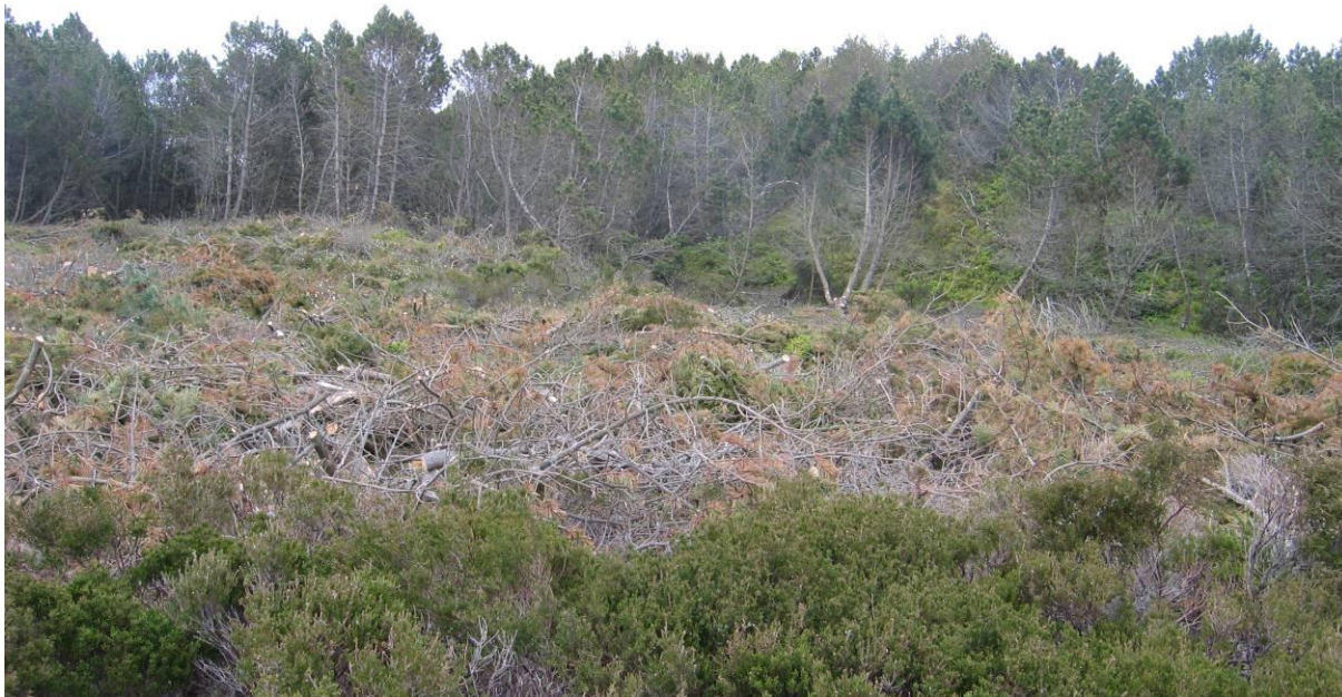
Årsholmen etter skogryddinga i 2009. Noko buskfu ru er saga ned på nordvestleg del av holmen . Meir skog bør fjernast. Hogstavfall og grov lyng skal bre nnast.