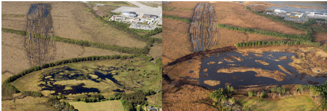
Figur 1. Landskapsskisse over Rørvikvatnet før og etter restaureringen

“Føremålet med fredinga er å ta vare på eit viktig våtmarksområde med tilhøyrande plantesamfunn, fugleliv og anna dyreliv». (Forskrift nr. 1197/1988)”.