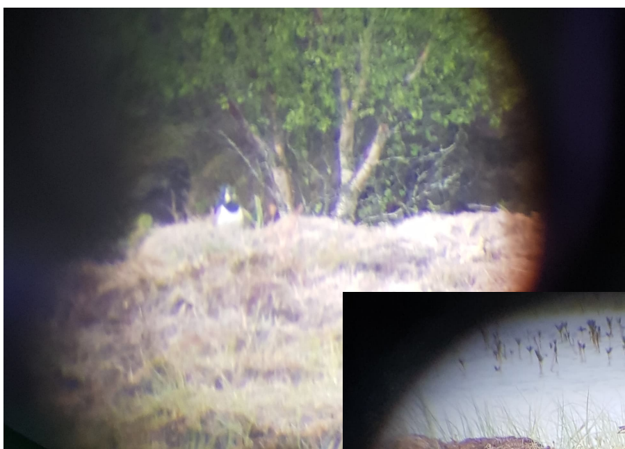
Vipa var tilstede