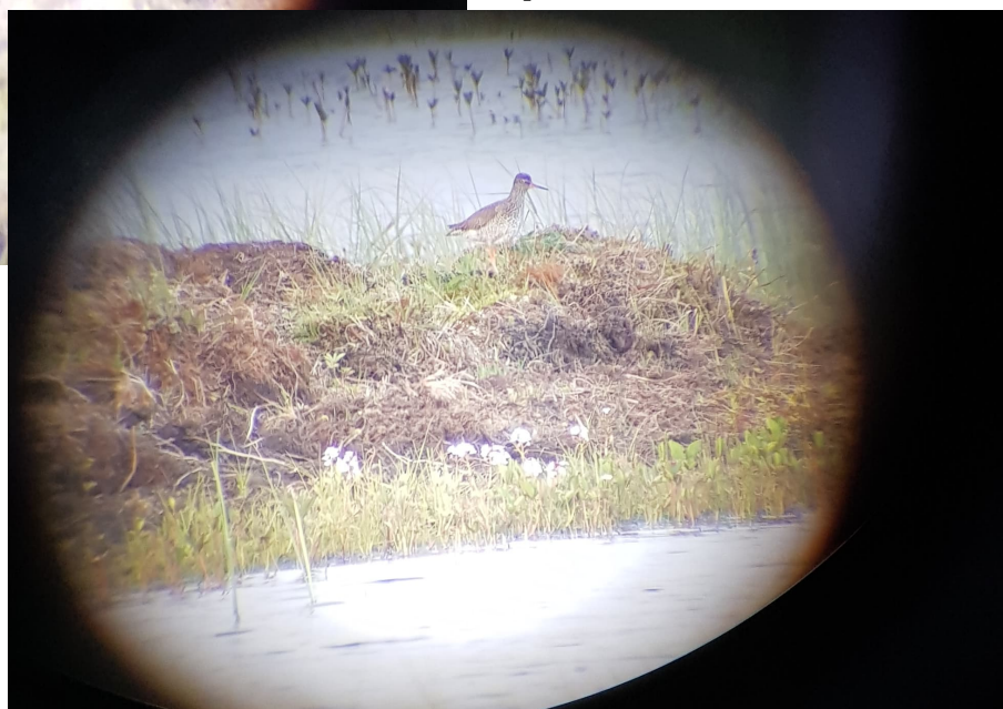
Rødstilken brukte holmene