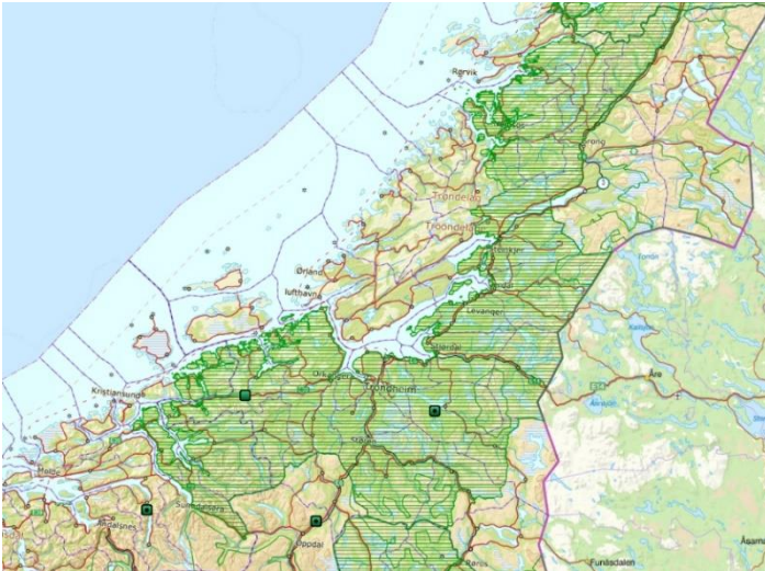
Figur 2. Skjermdump fra Rovbase 3.0 som viser dokumenterte skader forvoldt av gaupe på sau i perioden 27.10.2021 til 15.03.2022 (n= 7). Skravert område angir forvaltningsområde for gaupe.