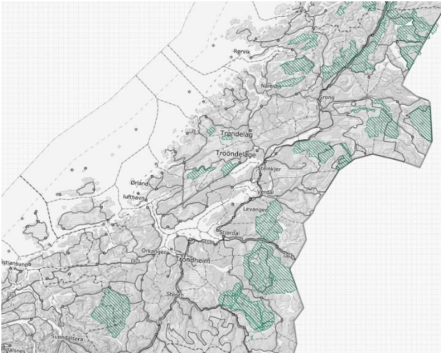
Figur 4. Grønt skravert område viser kalvingsland i region 6 (Kilden.no).