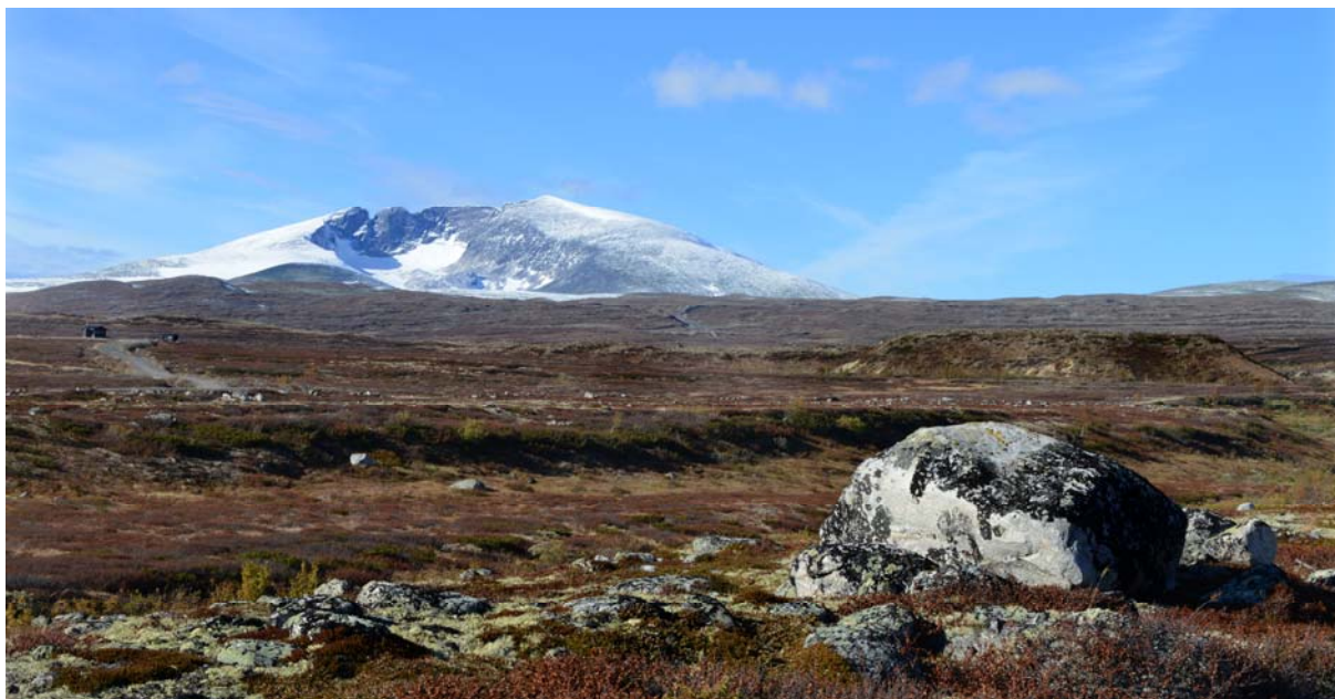
Hjerkinnskytefelt mot Snøhetta (Arne-Johs. Mortensen, Statens naturoppsyn)