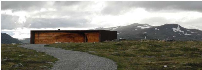
Viewpoint SNØHETTA på Tverrfjellet (Fylkesmannen i Oppland)

På samme måte som for temaet over må vi få en oversikt over bygninger, anlegg og innretninger i utredningsområdet, både før og etter restaureringsarbeidene er gjennomført. Vi skal videre belyse mulige konsekvenser et vern vil ha. Det vil være behov for tett dialog med Forsvarsbygg, samt en kartlegging av annen virksomhet.