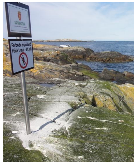
Figur 4: Merking av Grip naturreservat.

Med ein stadig veksande privat småbåtflåte på kysten og i fjordane, er det viktig å informere sjøfarande om vernet og om ferdselsforbodet i hekketida. Vi ser det også som eit mål å informere om fuglelivet og naturkvalitetane i sjøfuglreservata. Fylkesmannen vil utarbeide informasjonsplakatar om naturreservatet med m.a. kart, foto og vernereglar til å hengje opp på plassar der båtfolk ferdast, t.d. småbåthamna.