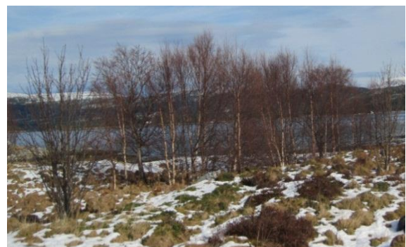
Figur 3: Tre som skal fjernast i naturreservatet.

Kor ofte hogst/rydding av tre og kratt bør skje, må sjåast i samheng med andre skjøtselstiltak. Andre tiltak som t.d. beiting og brenning kan redusere behovet for rydding av kratt. For å unngå gjengroing med påfølgjande negative følgjer for verneformålet og for å