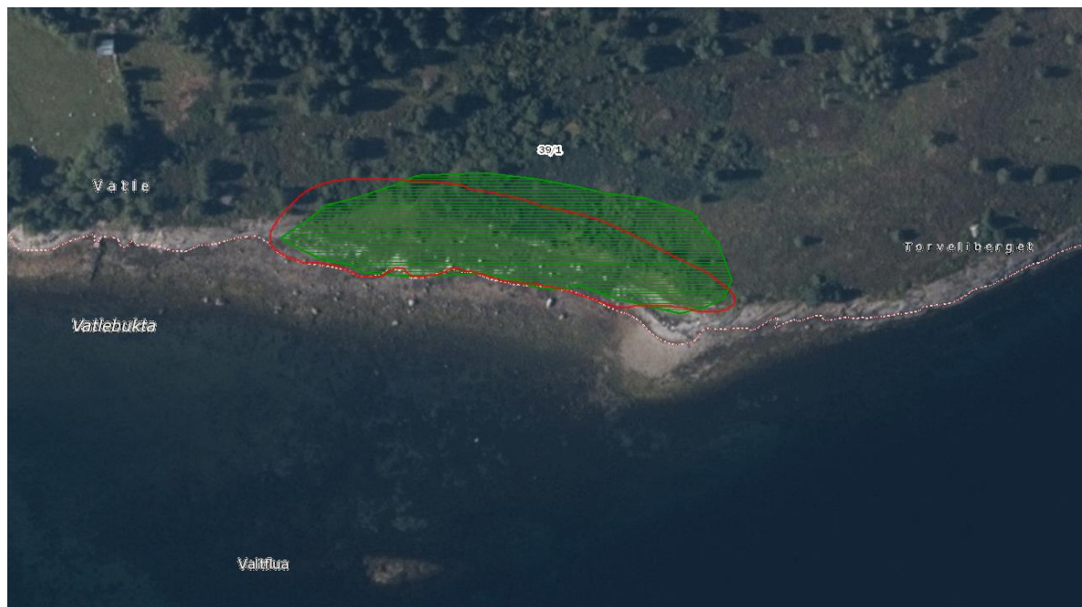
Foto tatt på lokaliteten Tautra: Vatlebukta 22.09.2015

Kart: Det vart laga ny avgrensing vist med raud strek. Gamal avgrensing er grøn.