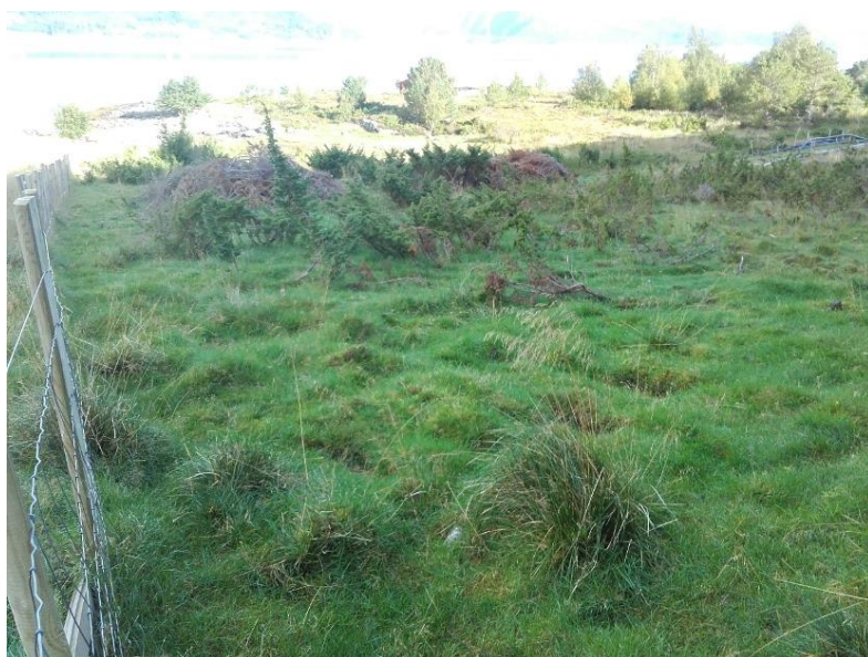
Foto frå lokaliteten Tautra: Nordigardsbukta tatt 22.09.2015

Bildet ovanfor er tatt på austsida av gjerdet, bildet nedanfor er tatt på vestsida av gjerdet.