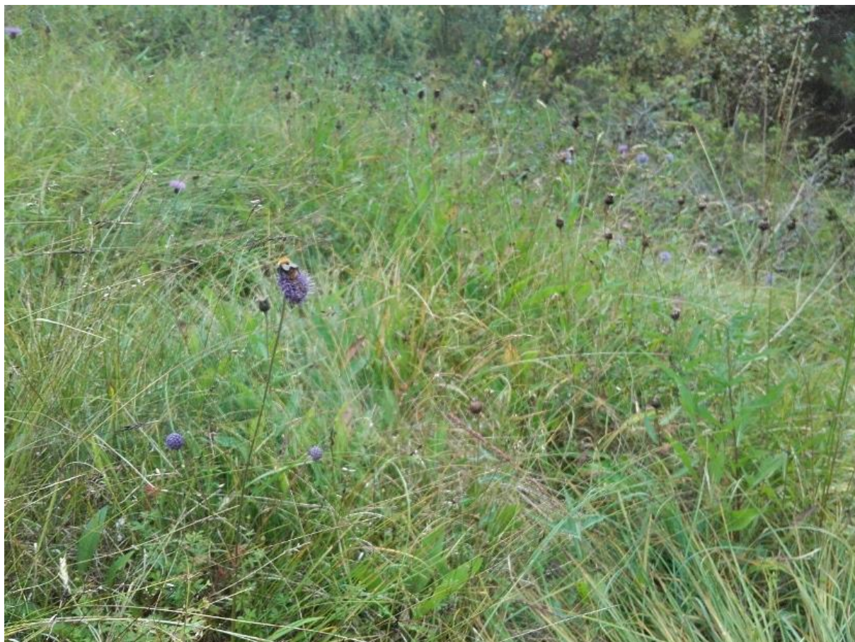
Foto frå lokaliteten Tautra : nedom berga tatt 22.09.2015