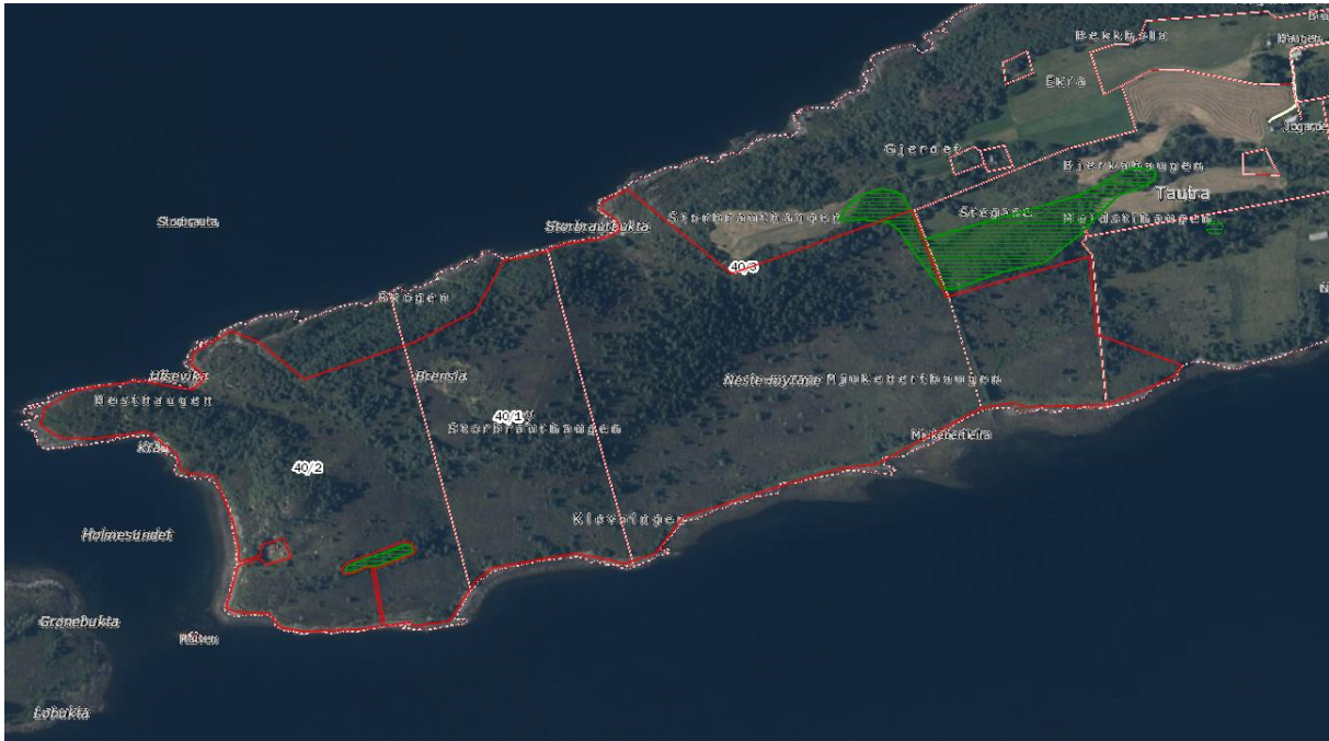
Foto tatt på lokaliteten Tautra vest den 22.09.2015