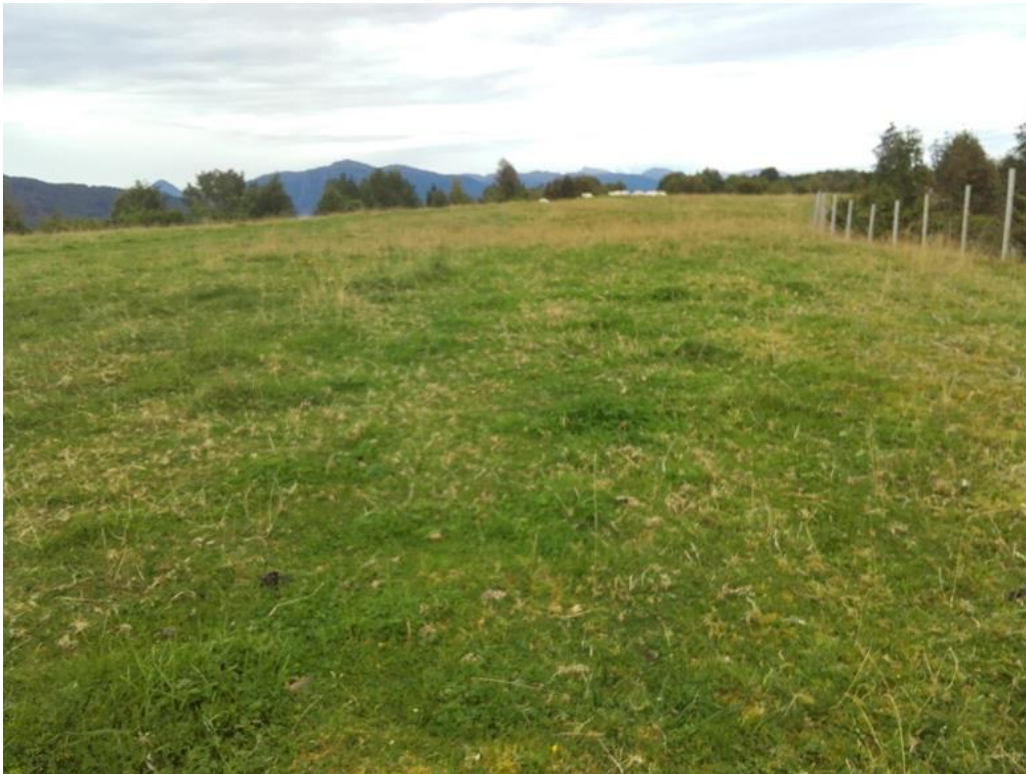
Foto frå Storbrauthaugen tatt 22.09.2015

På kartet under er Storbrauthaun og Gjerdet teikna inn med blå strek. I tillegg er det avmerka to blå ovalar. Dette er parti som såg ut til å vere noko artsrike og som det kan vere verdt å sjå nærare på ved neste høve.