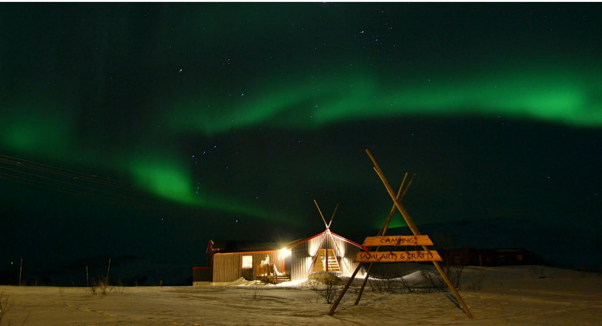
Finngammvannet – 8 km fra Kjøllefjord - Nordkynhalvøya