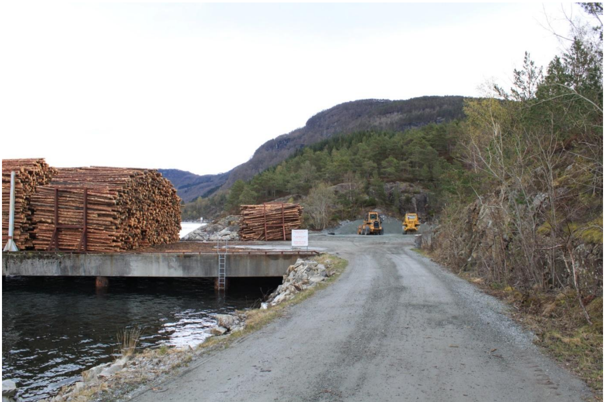
Søndenåneset tømmerkai – Vindafjord

Stavanger oktober 2013 Rogaland Skognæringsforum Gerd@Skogselskapet.no