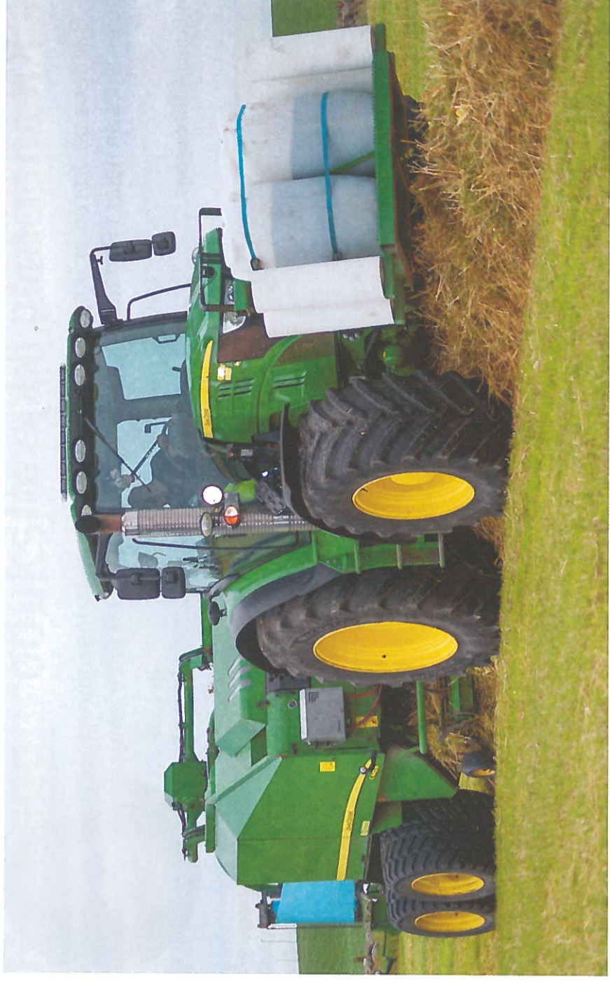
Stort og rasjonelt: - Omsynet til økonomi er gjennomgåande viktigare for bønder på Jæren enn i resten av landet, og dette får oftare forrang framfor andre omsyn, seier forskar Oddveig Storstad.