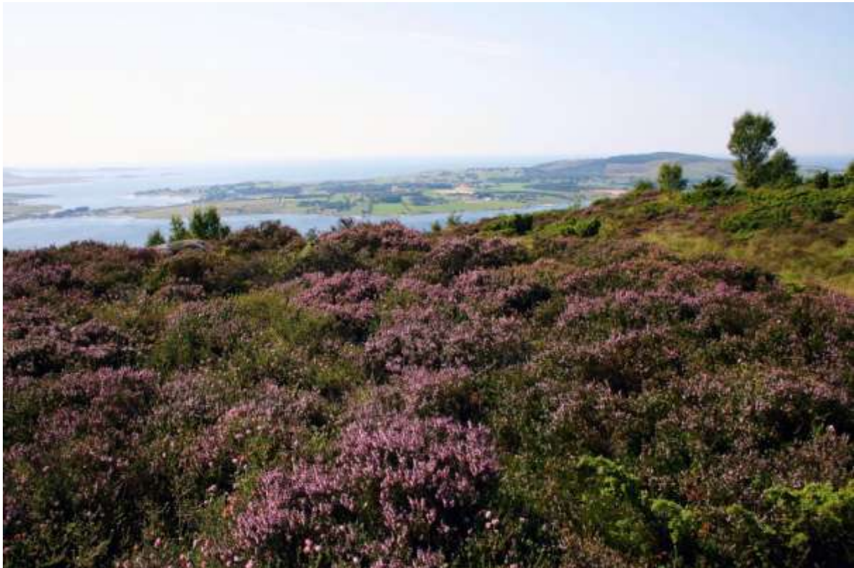
Selsfjellet mot Mosterøy

Jordbruket er viktig for å ta vare på biologisk mangfald. Mange artars levested er knytt opp til ulike driftsmetodar i jordbruket. Med naturmangfaldlova blei omsynet til biologisk mangfald forsterka. I Regionalt miljøprogram er det viktig å understreke at tilskot skal gå til føretak som har aktiv skjøtsel av definerte naturverdiar, og skal ikkje sjåast på som ei erstatningsordning for ulike lovpålegg etter naturmangfaldlova.