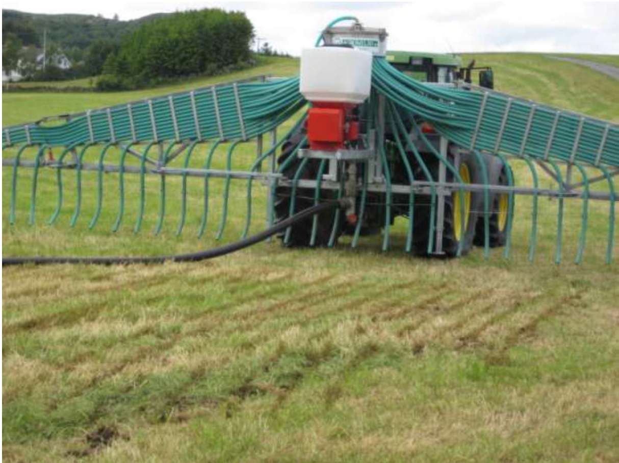
Spreieutstyr for nedlegging av husdyrgjødsel med slangetilkopling til gjødsellager

Husdyrgjødsel er ein verdifull ressurs i jordbruket. Spreiemetodar som gjer at gjødsla raskare kjem i kontakt med jord førar til mindre tap av næringsstoffar. Metodane gir mindre tap av ammoniakk til luft, mindre næringsavrenning til vassdrag og mindre lukt i samband med spreieinga. Den nasjonale pilotordninga med tilskot til miljøvenleg spreieing av husdyrgjødsel blei avslutta i 2012, og frå 2013 er tilskot til miljøvenlege metodar tatt inn i regionalt miljøprogram.