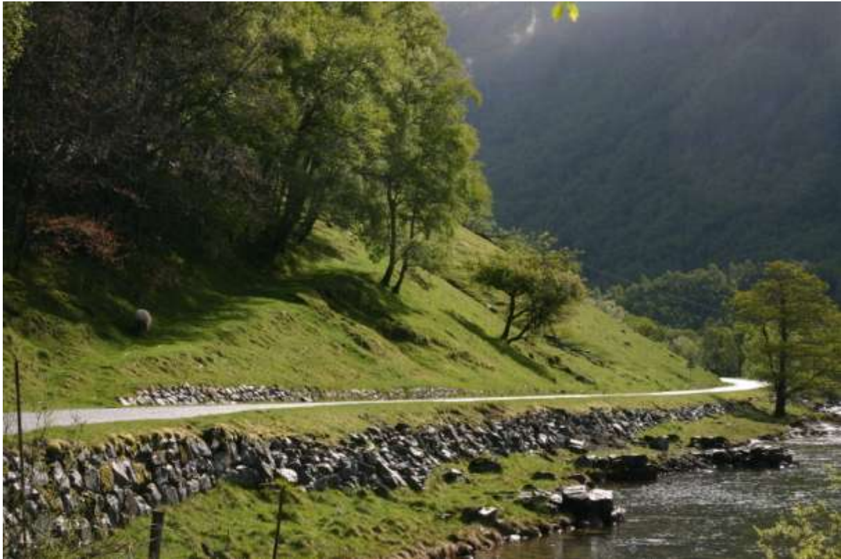
Bratt areal i Espedalen

Fleire stader i Rogaland er gjengroing av kulturlandskapet eit aukande problem. Det opne og varierte landskapet er svært viktig for trivsel og busetnad. Reiselivet tener også på opne og vakre kulturlandskap. Omstillinga i landbruket er stor. Tempoet i gjengroinga er så stor at det vil vere umogleg å stoppe utviklinga alle stader. I Regionalt miljøprogram har vi derfor valt ut einskilde stader der vi meiner det er spesielt viktig å hindre gjengroinga.