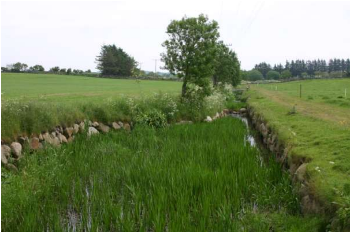
Reinsepark

Diffus næringsavrenning frå jordbruket er ei kjelde til eutrofiering av vassdrag. Føremålet med tiltaka er å redusere tapet av næringsstoff og plantevernmiddel. Vassdrag som etter Vassdirektivet si klassifisering er sterkt påverka av jordbruk, og som har dårleg vasskvalitet er prioritert.