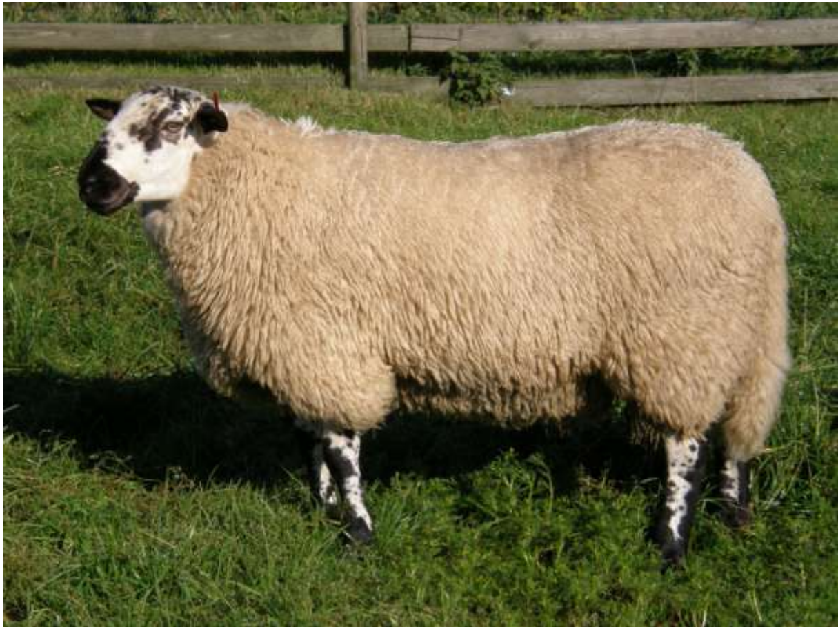
Fuglestadbrogete sau er ein av rasane med spesiell utbreiing i Rogaland

Ein bevaringsverdig rase er ein nasjonal rase med så få individ at dei er vurdert som trua eller kritisk trua. Det blir gitt tilskot til raser som har sitt opphav frå Vestlandet, eller har ein spesiell utbreiing her. Rasen må vere på Norsk genressurscenter sin oversikt over bevaringsverdige husdyrrasar.