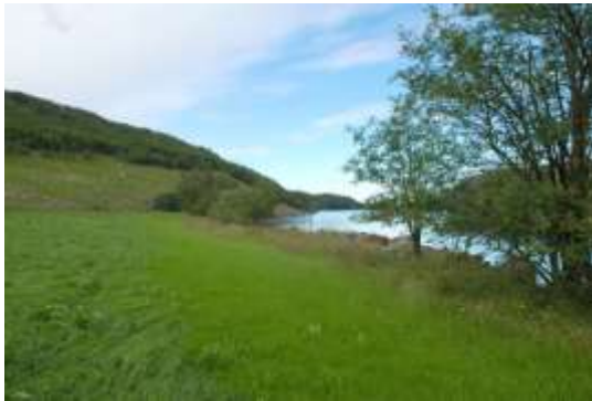
Ugjødsla randsone i eng