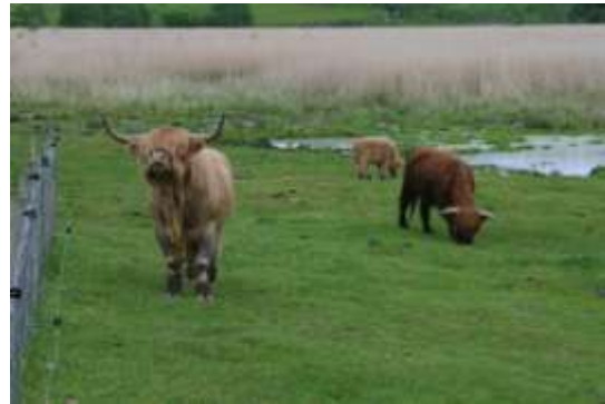
Villsau på utmarksbeite og Skotsk høylandsfe

Tilskotet kan bli gitt til ammegeit og dyr av ekstensiv rase som beitar på utmarksbeite. I beitetida skal grovfôropptaket i all vesentlig grad vere gjennom beiting. Med ammegeit meinast geiter som har kjeet minst ein gong, og som ikkje er mjølkegeiter.