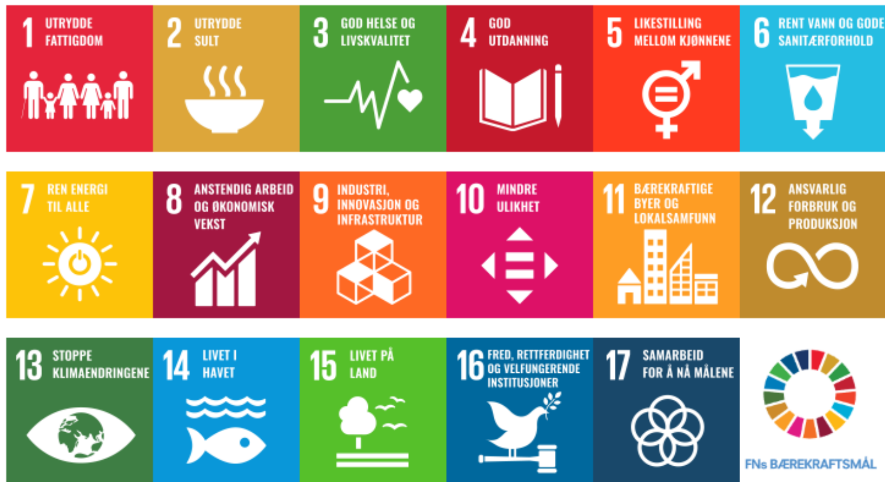
Figur 2: Bærekraftsmålene.